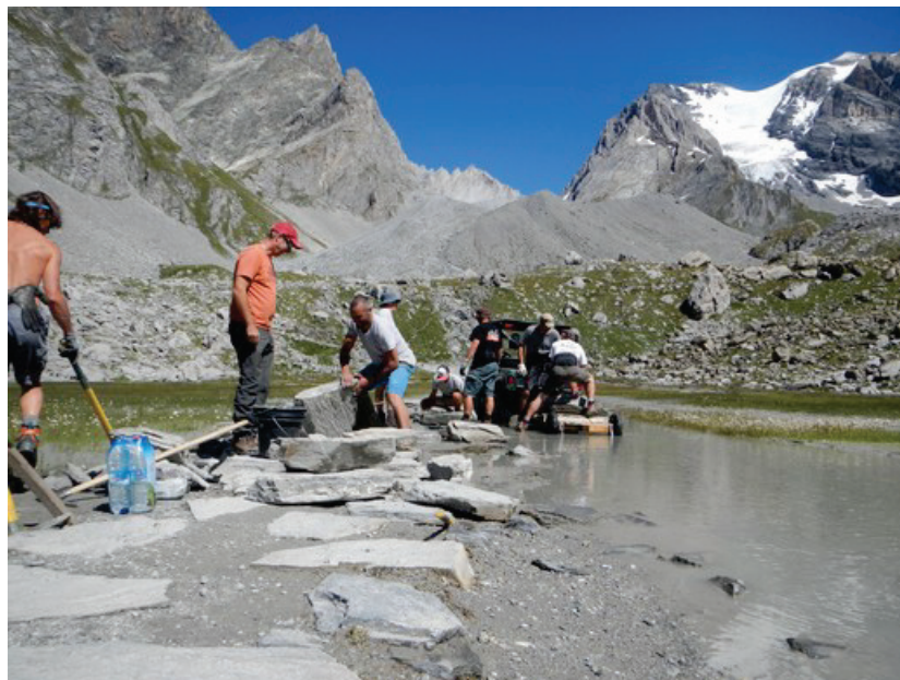
Photos du chantier du lac des Vaches

Septembre : Le Parc a été sollicité par l'Association des Bottes de 7 Lieux et la mission locale d'Albertville pour accompagner un chantier à but social avec des jeunes en difficulté. Une partie de sentier dans le cirque de l'Arcelin a ainsi pu faire l'objet d'un entretien. Les jeunes issus d'un milieu sensible ont ainsi découvert la montagne sous tous ses angles et le travail d'ouvrier du Parc. Même si la tâche n'a pas été tous les jours facile, ce chantier a permis de les sortir de leur quotidien et même pour certains de trouver une vocation professionnelle.