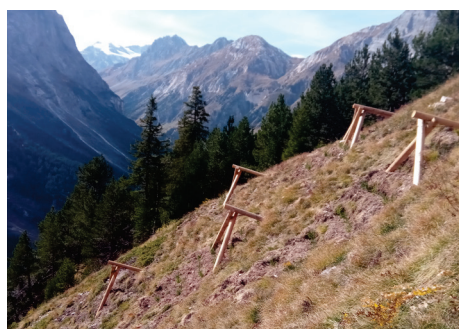
Trépied au couloir de la Chaberne

Sur ces plaques de reptation, les moyens de déclenchement d'avalanche classiques sont inefficaces.