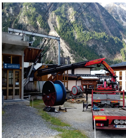
Livraison de la bobine

Un chantier d'envergure pour des câbles flamboyants neufs pour bien démarrer la saison et les 30 suivantes !