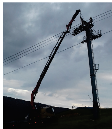
Dépose des balanciers

15 ans après son installation, le télésiège débrayable 6 places de l'Ancolie a fait l'objet de sa première grande inspection réglementaire cet été.