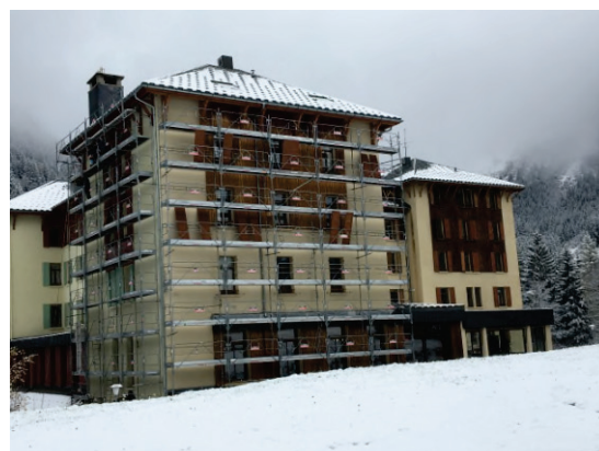
Pignon de la Façade Sud/Ouest pendant les travaux