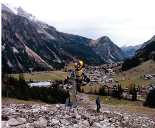
Enneigreur mono fluide sur tour

Cet automne, sous la conduite de la commune, c'est le stade d'Isertan qui a été équipé avec six enneigeurs mono-fluides.