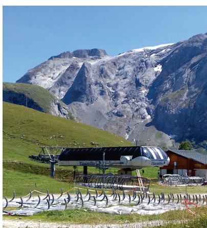
Sièges démontés au départ de l'Ancolie

L'Ancolie a passé sa visite d'inspection :