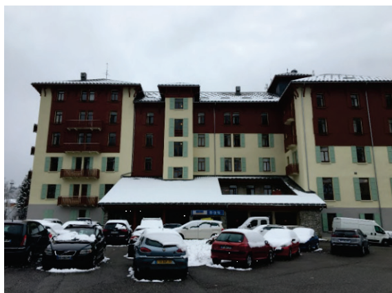
Façade Nord/Est terminée

Pendant la saison d'hiver, le programme des travaux intérieurs à la charge de la Sogespral sera à l'étude en concertation avec Vacancier avec pour objectif une réalisation sur l'année 2019.