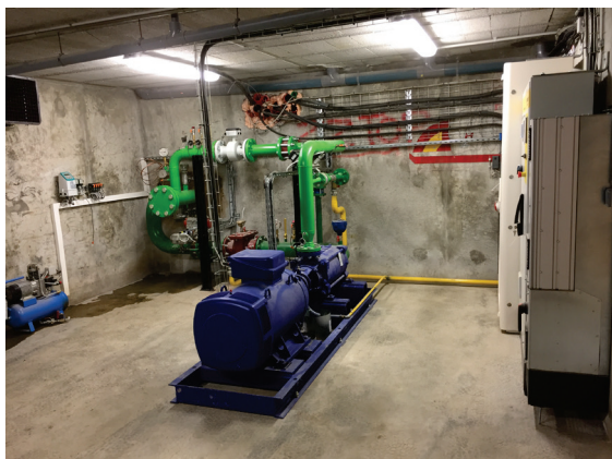
Usine à neige

Comme nous vous l'annoncions dans un précédent bulletin municipal, les travaux du stade de slalom d'Isertan ont été réalisés et finalisés cet automne.